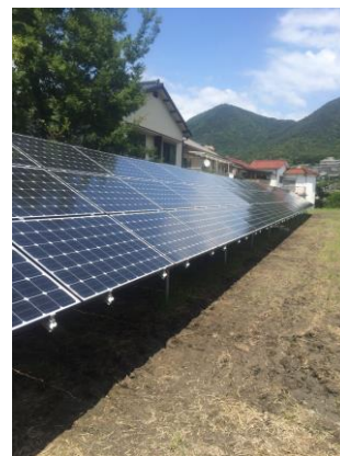
プレミアムソーラー施工写真